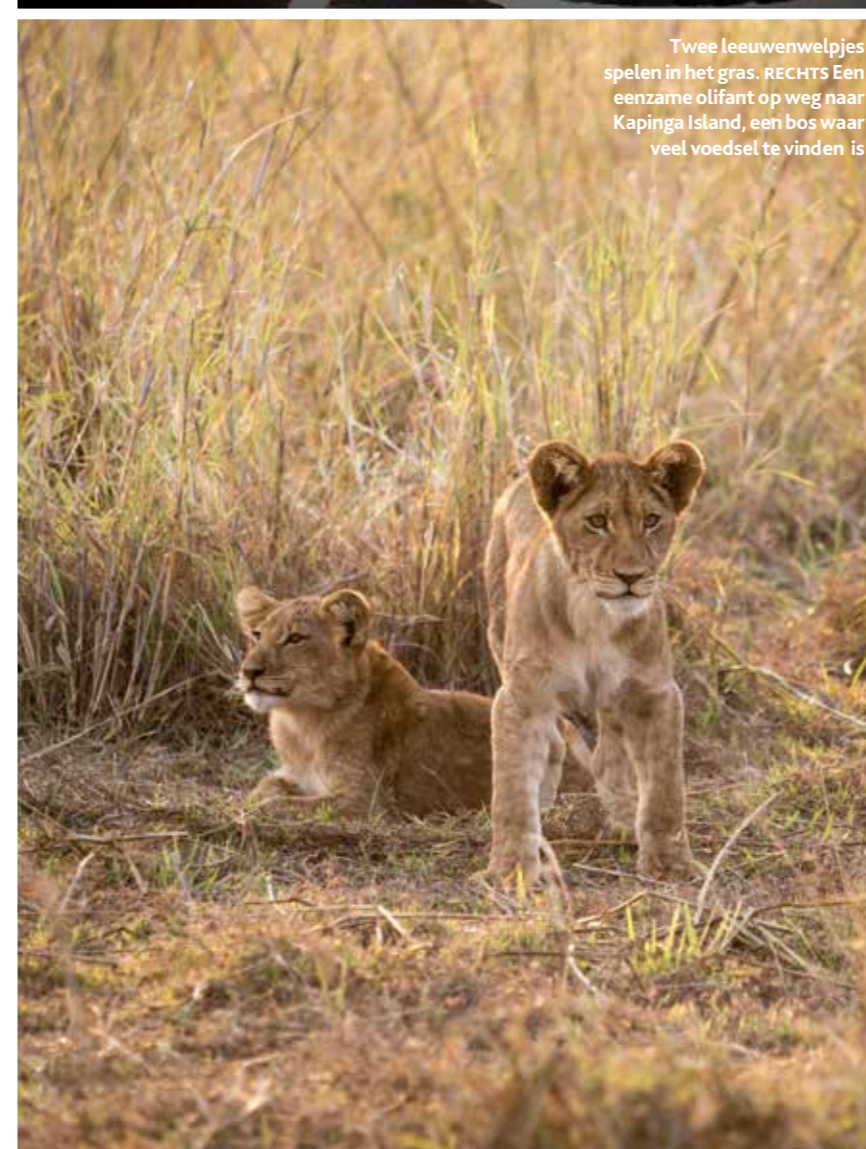
Twee leeuwenwelpjes spelen in het gras. RECHTS Een eenzame olifant op weg naar Kapinga Island, een bos waar veel voedsel te vinden is

Tien minuten later komt de auto tot stilstand vlak bij een zestal leeuwen. Twee welpjes spelen in het gras, terwijl de rest van de familie slaapt. Dat doen →