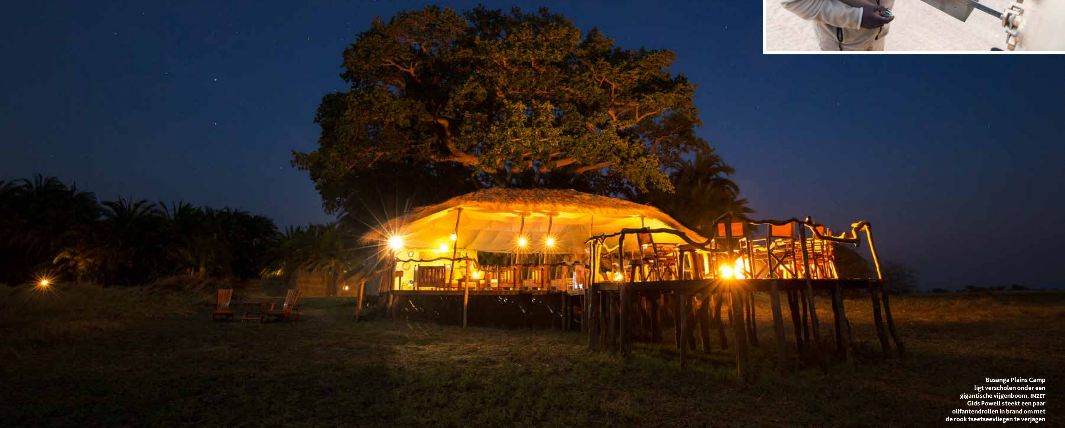
Busanga Plains Camp ligt verscholen onder een gigantische vijgenboom. INZET Gids Powell steekt een paar olifantendrollen in brand om met de rook tseetseevliegen te verjagen