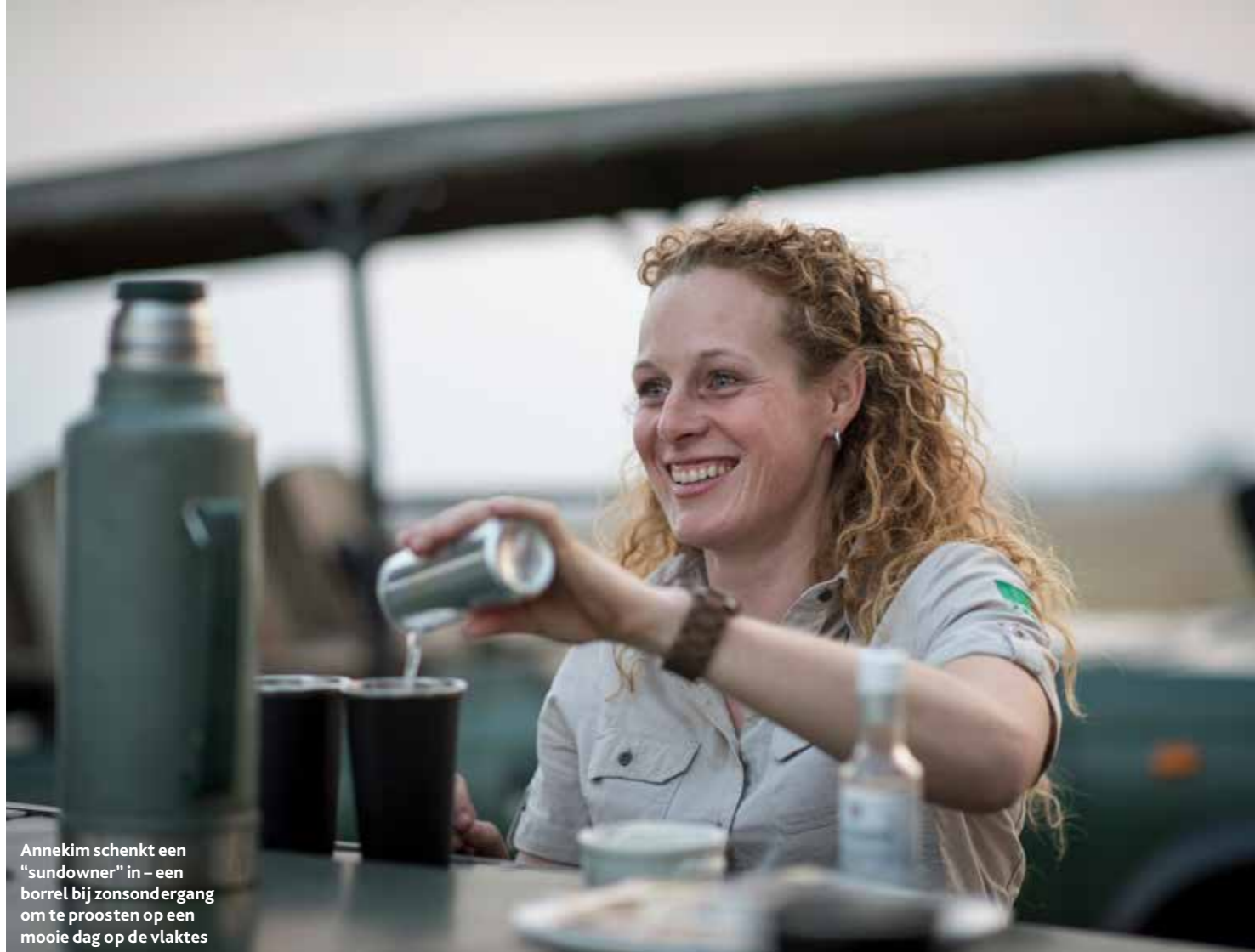
Annekim schenkt een "sundowner" in – een borrel bij zonsondergang om te proosten op een mooie dag op de vlaktes