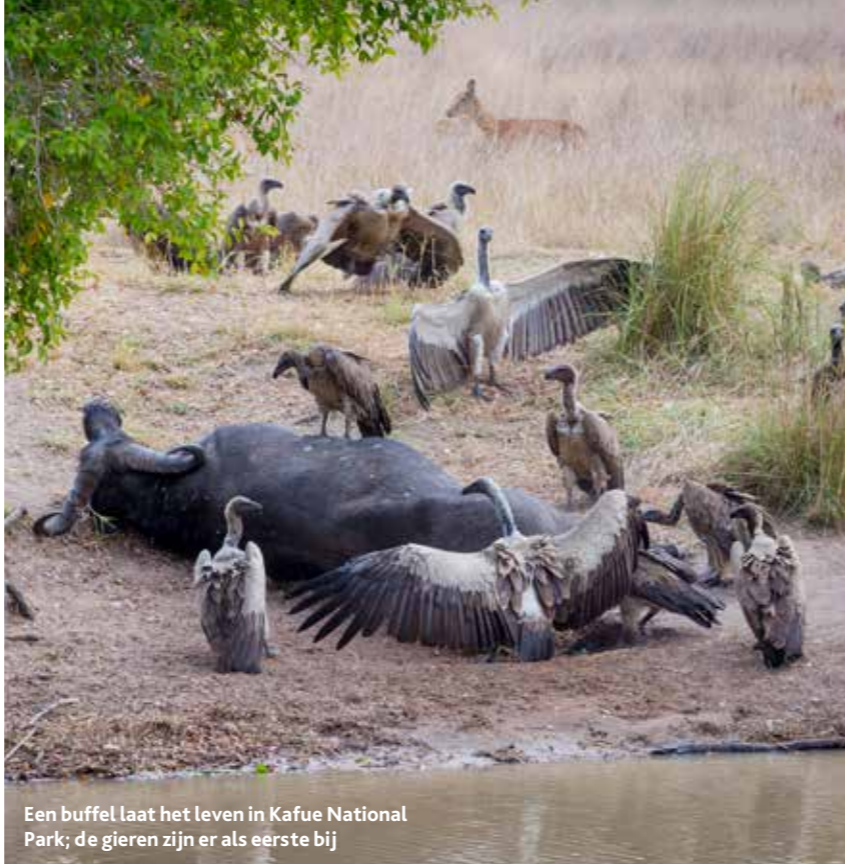
Een buffel laat het leven in Kafue National Park; de gieren zijn er als eerste bij

Onze ontmoeting met de witruggieren vindt plaats vlak bij het Fig Tree Bush Camp, een van drie kampen van Mukambi Safaris, dat gerund wordt door het Nederlandse stel Edjan en Robyn van der Heide. ‘Fig Tree heeft alles wat een mooi bush camp nodig heeft: een lagune en vlakte waarover je kunt uitkijken, een uniek ecosysteem en heel veel wilde dieren. De Shishamba Loop bij Fig Tree is nu onze meest productieve safaririt.’ Op advies van Edjan en Robyn doen we de Full Kafue Experience , langs alle drie de kampen in het park.