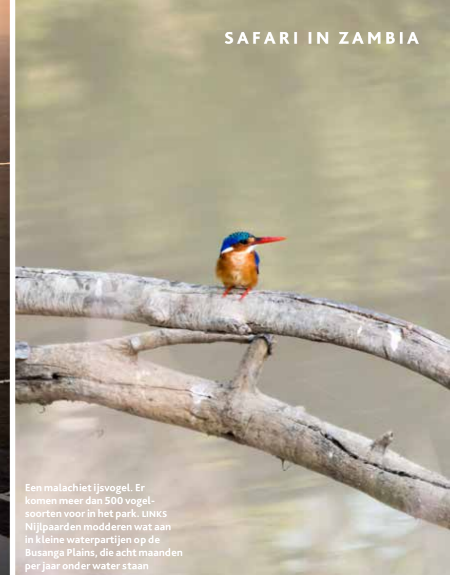
Een malachiet ijsvogel. Er komen meer dan 500 vogelsoorten voor in het park. LINKS Nijlpaarden modderen wat aan in kleine waterpartijen op de Busanga Plains, die acht maanden per jaar onder water staan