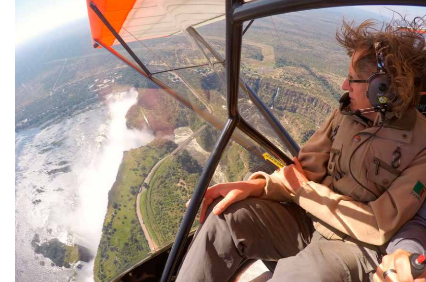
Met een ultralight over de Victoria Falls. Ultieme beleving!

in hoge concentraties en auto's in files langsrijden. Ons wildgebied is zo groot als Nederland. Hier kán het voorkomen dat je uren niets bijzonders ziet. Het wild is schuw en gedraagt zich natuurlijk."