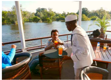
Cruise op de Zambezi-rivier.

Een beetje hyper zit ik inmiddels weer in de landrover. De rangers verdwijnen weer tussen de struiken. Wauw. Wie maakt dit nu mee. Zambia is voor mij een soort rollercoaster aan het worden met allemaal ervaringen die raken aan de kern van het bestaan. Indrukwekkend. En dat gaat door als ik in één van de vele traditionele dorpen loop. Hier is de chieft nog de baas. Zijn wetten staan boven de wetten van