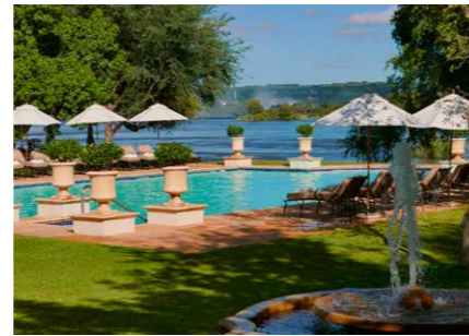
Royal Livingstone Hotel met zicht op de waterval.

de officiële regering. Hij oordeelt, en als het de stam niet langer bevalt wordt hij vergiftigd. De wetten van Zambia houden dat niet tegen. Vrouwen pellen ondertussen pinda's, kinderen spelen een spelletje mankala, mannen maken houten beelden.