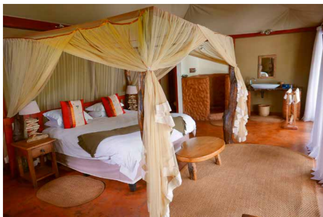
De luxe Safari tent. Canvas tussen mij en de leeuwen.

omheining, zoals in het Krugerpark in Zuid-Afrika. Rangers begeleiden mij zelfs op een safari te voet - en zo sta ik in het dichte struikgewas plotseling op 10 meter van vier machtige neushoorns van elk 2000 kilo. En even later voel ik me ontdekkingsreiziger Livingstone, als ik vanuit een open vliegtuigje de Zambezi-rivier met donderend geweld van de Victoria watervallen zie storten. Ga je mee? Afrika beleven?