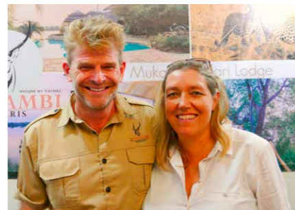
Leven in de bush met een eigen lodge. Zij deden het.

"When is the pick up? When they come!!" Mijn Indiase reisgenoot snapt het helemaal. Tijd is hier rekbaar. Of, zoals wordt gezegd: "We have the watch, they have the time." Zambia hoort bij die landen in Afrika waar reizen nog avontuur is. Waar een planning makkelijk verandert en waar mensen en wilde dieren gezamenlijk het land delen. Zambia ligt letterlijk midden in Afrika. Iets ten zuiden van de evenaar. De big five leeft hier - en niet achter een