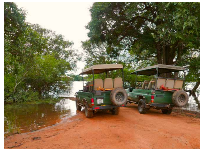
De game drive start aan de andere kant van de rivier.