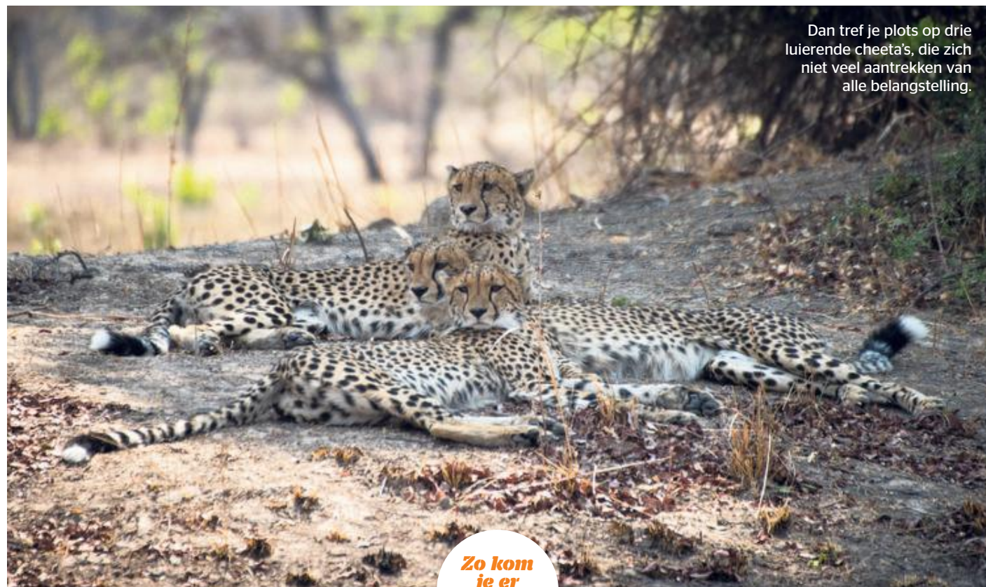
Dan tref je plots op drie luierende cheeta's, die zich niet veel aantrekken van alle belangstelling.