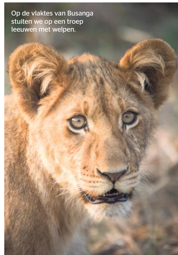
Op de vlaktes van Busanga stuiten we op een troep leeuwen met welpen.