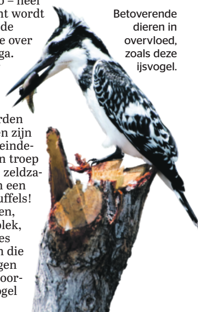
Betoverende dieren in overvloed, zoals deze ijsvogel.

Bij de papyrusbossen, Annekims favoriete plek, rijden we langs kuddes Litschie-waterbokken die door het water springen en een koperstaartspoor-koekoek, een forse vogel